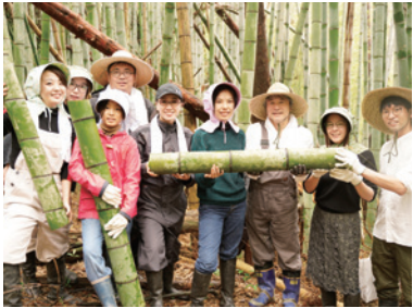
竹取り Collecting Bamboos