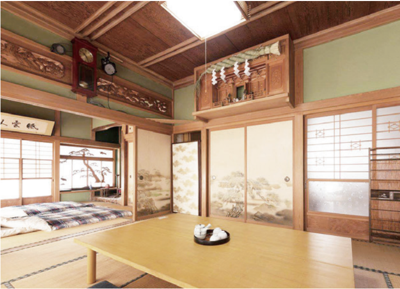
椿 HOUSE 室内 / Tsubaki House interior