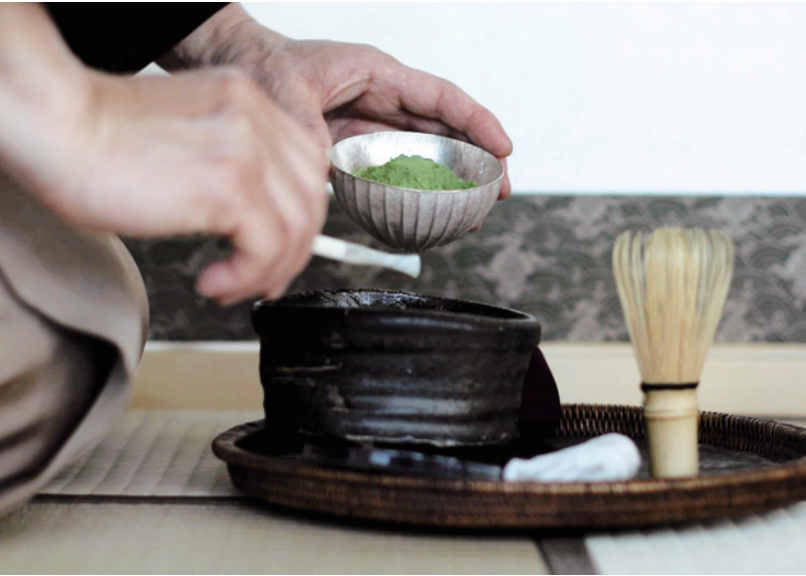
茶道体験 / Tea Ceremony