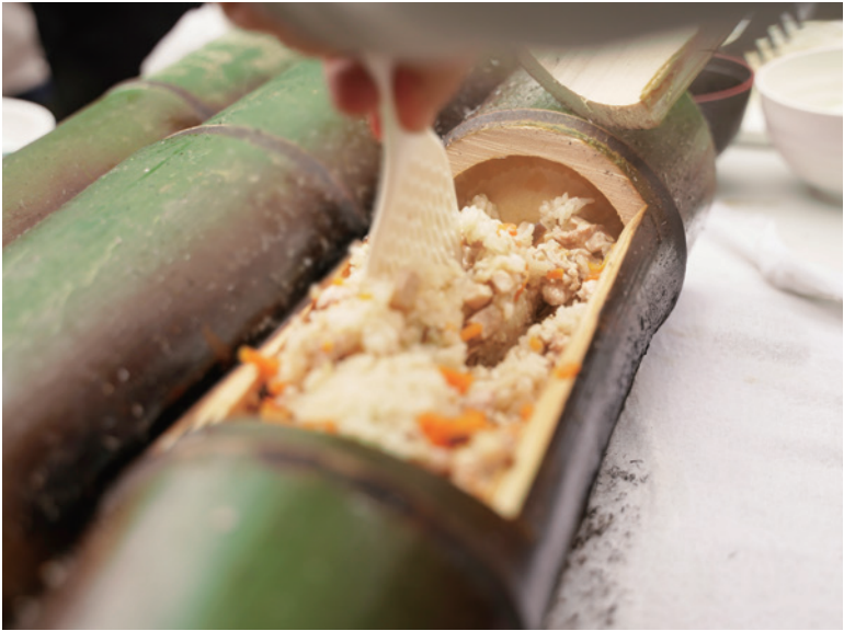
竹筒BBQ / Bamboo Barbecue