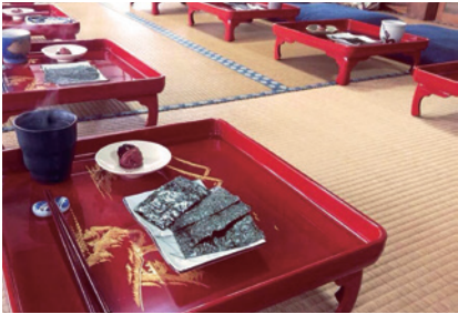
ファスティング合宿 Fasting camp