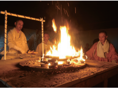
神崎寺 護摩焚き Kozaki Temple "Spirit-Cleansing Fire Ceremony"