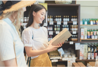
道の駅 発酵市場 Japanese Farmers market and more! "Fermentation market "