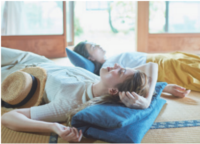
畳で休憩 Rest on tatami floor