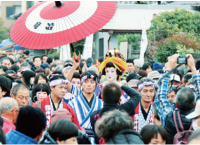
酒蔵祭り Sake Brewery Festival