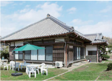
椿 HOUSE 外観 Tsubaki House