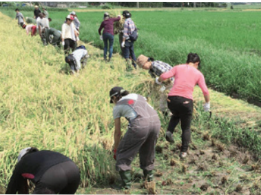
農業体験 Rice Harvesting