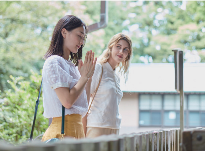
神崎神社 参拝 / Kozaki Shrine

Throughout seasons, we offer unique events and cultural experiences to enrich your life.