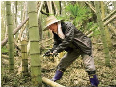
竹刈り Bamboo cutting