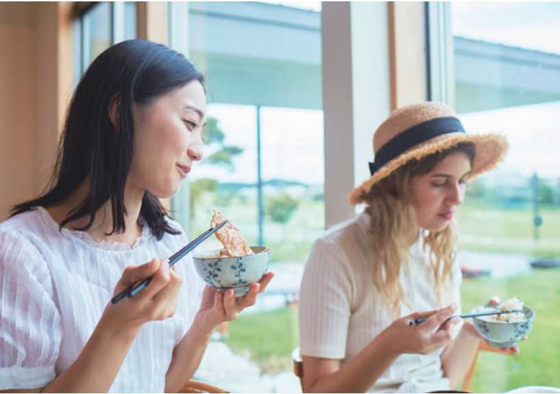
道の駅 発酵の里こうざき「レストランオリゼ」 "Road Station Fermentation Village Kozaki" a farmer's market extraordinaire and "Restaurant Oryzae"

Two traditional Sake brewery of over 300 years, "Nabe- dana" and "Terada Honke" lead the way for "Sake Brew- ery Festival" and over 50,000 visitors gather for the fun each year.