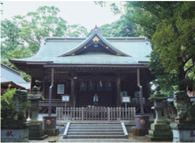
神崎神社 本堂 Kozaki Shrine - Main Hall -